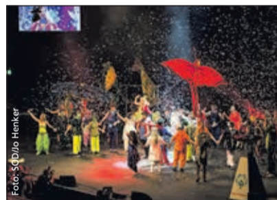
Die bunte Truppe aus Marsberg verzaubert das Publikum.