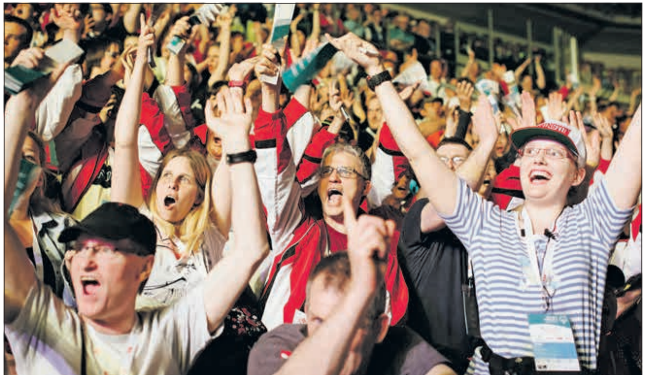
Die Stimmung bei der Eröffnungsveranstaltung im ISS Dome war fantastisch.