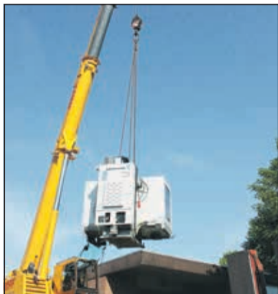
Die „fliegenden“ Maschinen

50 neue Arbeitsplätze für Menschen mit psychischen Behinderungen sind hier in den letzten Monaten entstanden. Gefördert wird das Projekt vom Landschaftsverband Westfalen-Lippe.