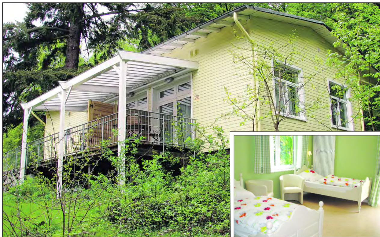
Inmitten der Natur – das Kleine Waldhotel im Sauerland.

Das Kleine Waldhotel ist ein Selbstversorgerhaus und liegt am Rande eines Waldes im Sauerland, nur wenige Gehminuten vom Zentrum entfernt. Es verfügt über zwei Doppelzimmer mit jeweils einem angrenzenden Bad inklusive Dusche sowie einer kleinen Küchenzeile, die zum gemeinsamen Kochen einlädt. Jedes Zimmer ist ausgestattet mit einem Fernseher und einem Telefon, über das man angerufen werden kann. Die idyllische Terrasse lädt dazu ein, die Sonne zu genießen und die Seele