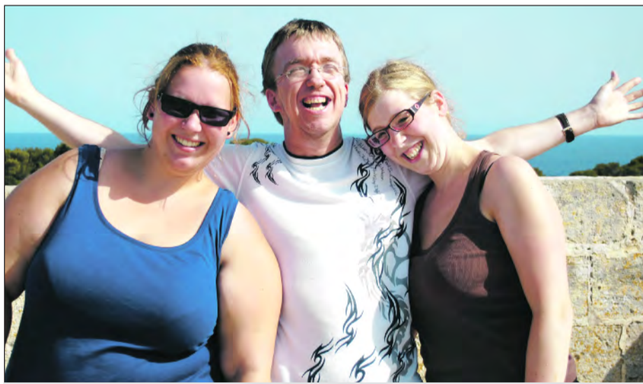
Mit Spaß dabei

Hierzu werden engagierte und verantwortungsbewusste Reisebegleiter gesucht, die den Menschen in den Bereichen Pflege, hauswirt-